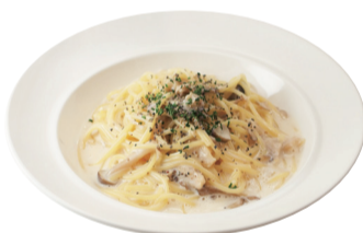
きこのチーズクリーム