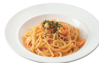
小海老のトマトクリームソース (+¥100)*