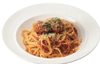
ミートボールのボロネーゼ