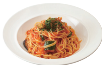
彩り野菜のトマトソース