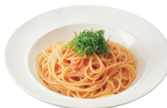
明太子ソース大葉トッピング