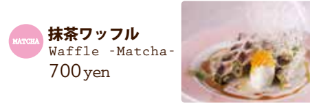
MATCHA 抹茶ワッフル Waffle -Matcha- 700yen